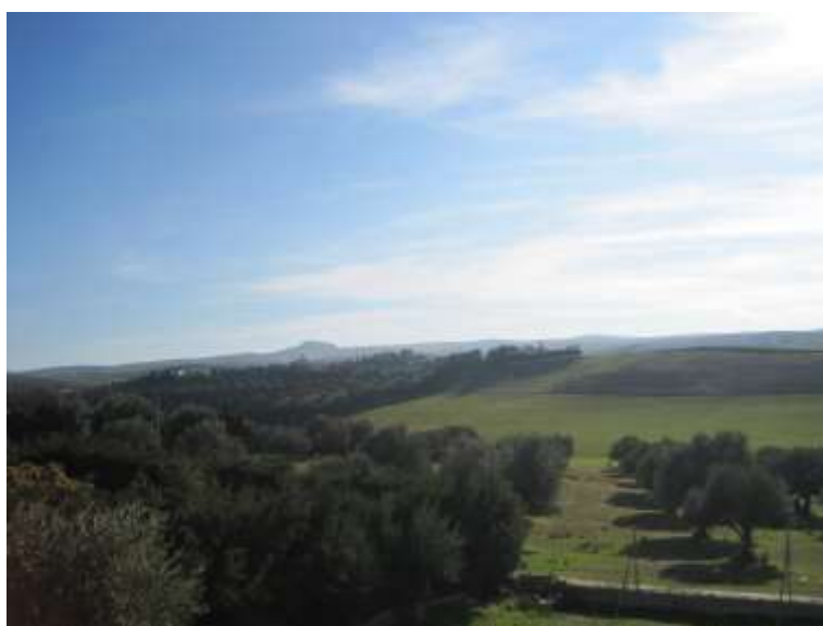
El montículo que se divisa en el horizonte de la imagen es Montevives, visto desde el Muulasterio Tseyor La Libélula

Su situación geográfica se encuentra en las proximidades del Muulasterio Tseyor La Libélula, y es perfectamente visible en el horizonte desde las ventanas del edificio. Su distancia en línea recta es de unos 10 km.