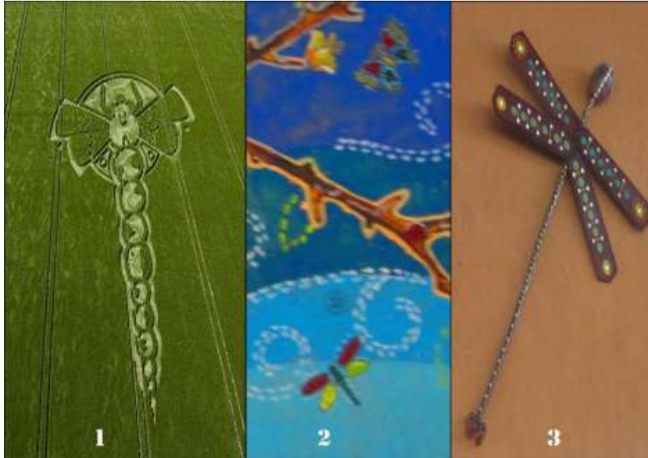
Imagen Núm. 1 CÍRCULOS DE LA COSECHA: LA LIBÉLULA (Crop Circles) Una imagen de Círculo de la Cosecha, apareció en Little London el 3 de junio de 2009, tiene una forma inesperada de una “Libélula”, y fue inmediatamente publicada por la mayoría de los diarios londinenses. Ni por lejos, nadie ha tenido una mínima noción de lo que pudiera significar. Si los benévolos extraterrestres realmente nos están dando mensajes informativos en las cosechas, tal vez para evitar la censura de los gobiernos mundiales, entonces, ¿Qué nos están queriendo decir con esta imagen en particular?

Imágenes Núm. 2 y 3. LIBÉLULAS EN ISLA MARGARITA-VENEZUELA-CONVIVENCIAS TSEYOR OCTUBRE 2012.